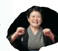
古今亭菊千代 落語家

本日の、世代を超えた桜美林魂の集大成「合唱物語 石ころの生涯」をどうぞごゆっくりお楽しみくださいませ。