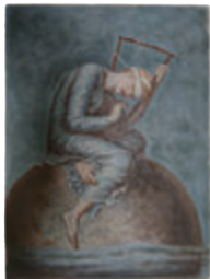
ワッツ「希望」