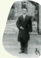
④中国に渡った日本人宣教師第一号