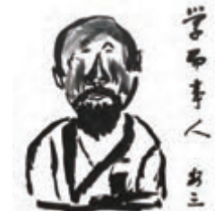
清水安三先生、88歳当時の自画像