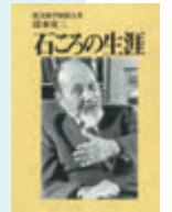
⑯「石ころの生涯」表紙