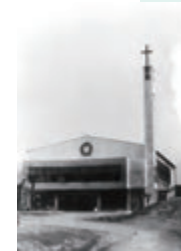
⑮荊冠堂チャペル完成