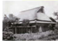
①滋賀県高島郡の生家