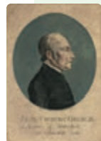
⑨ジャン＝フレデリック・オベリン