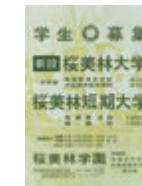
⑰桜美林大学一期生学生募集ポスター