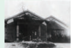
⑫設立当初の桜美林高等女学校