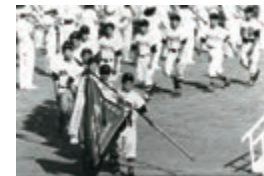
⑱桜美林高等学校野球部夏の甲子園大会で優勝