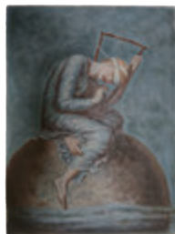
ワッツ「希望」

失わず 望み失わず 希望の音を奏でよう それでも奏でる豎琴は ただ一本の糸がなくても 乙女よ わたしは わたしは 失わず 望み失わず 希望の音を奏でよう