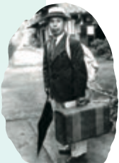
⑭寄付募集の国内行脚姿(販売用著書を背負って)